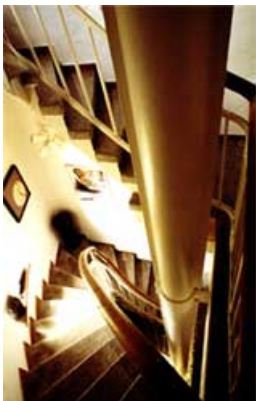
Der Weg nach oben (Treppenhaus im Turm)