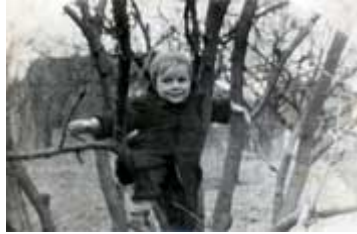
...hoch klettern musste er schon in frühen Jahren