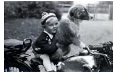
...mit seinem Hund Rex 1953 in Ostpreußen