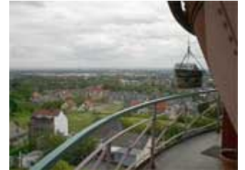
Der Fotografenkoffer hoch über den Dächern am Ziel angekommen