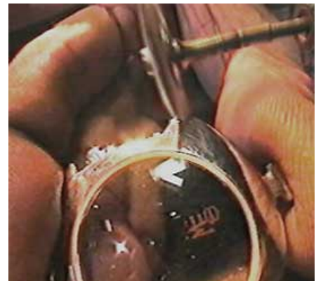
Feinarbeit am Uhrgehäuse