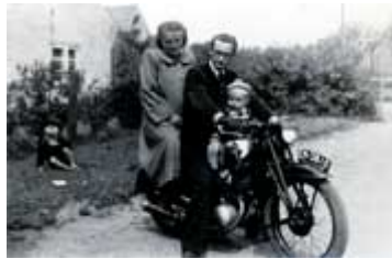
Mutter, Vater, erstes Kind 1953 in Ostpreußen

"Ich in einem Buch mit den großen Künstlern des ausgehenden 20. Jahrhunderts. Das hat mir riesigen Auftrieb gegeben". Plötzlich waren seine Werke im Ansehen und natürlich auch im Preis gestiegen. Anfänglich wollte ich es kaum glauben, als ein Museumsdirektor bei mir anrief und mir 3000 Mark für ein Bild anbot, für das ich einen Tag vorher noch 500 Mark verlangt hätte. Endlich konnte ich ohne Existenzangst arbeiten - ein tolles Gefühl." Galerien und Museen reißen sich um seine Präsenz. Viel Wirbel entsteht um den Mann, der aufgrund seiner Vielseitigkeit Anfang der siebziger Jahre als „Chaos" gilt. „Damals war ein guter Künstler jener, der sich auf eine Stilrichtung spezialisierte, wie zum Beispiel Öker, der immer nur Nägel in Bretter klopfte, das jedoch meisterhaft“, erinnert sich Erdtmann. Ausstellen lassen will er sich nur als „ganzer Künstler" - mit all seinen Talenten. Mit Skulpturen, Kollagen, Bildern in Öl und anderen Facetten. Für Ausstellungen nur mit Malerei oder nur mit Bildhauerei, wie es Kunstpápste verlangen, um ihn einzuordnen, ist er nicht zu haben - das ist dem Multitalent nicht genug.