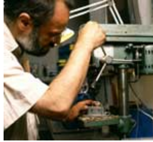
Hier wird das Bohrloch für den Tubus gebohrt.

Waldemar Erdtmann ist einer der vielseitigsten Künstler als Uhrdesigner, der im Rhein-Erftkreis heimisch wurde. Die heute leider häufig zu beobachtende einseitige Ausrichtung vieler Künstler mit Erdtmann fremd. In praktisch fast allen Stilrichtungen bereits tätig gewesen und mit 30jähriger Erfahrung unterwegs, vermag er mit Ideen seinen Uhrprojekten einen facettenreichen, subtil nuancierenden Ausdruck zu verleihen. Bezeichnend für ihn ist die unermüdliche Suche nach der adäquaten, das heißt materialgerechten Form für seine Uhrprojekte, denen er im zähen Ringen mit den verschiedenen Werkstoffen schließlich die stoffliche Hülle gibt. Die Form, die im Rahmen der Komposition, aus seiner Perspektive mit Licht und Farbe, der Bewegung die richtige Proportion im Gehalt die größtmögliche Aussagekraft und künstlerische Dichte bietet.