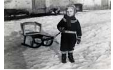
...im Masurischen Winter auf dem Bauernhof 1954