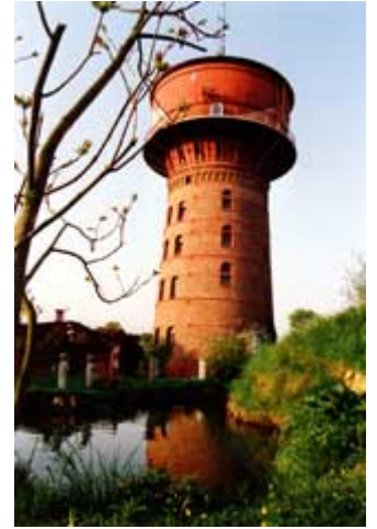
Das Atelier oben in der Stahlkugel