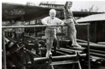
...mit dem Bruder "Bubi" auf dem Brunnenbauerhof