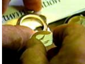
Das Zifferblatt wird in das handgefertigte Uhrgehäuse eingebaut.